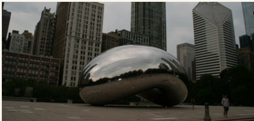
The Bean, Iconic symbol of Chicago