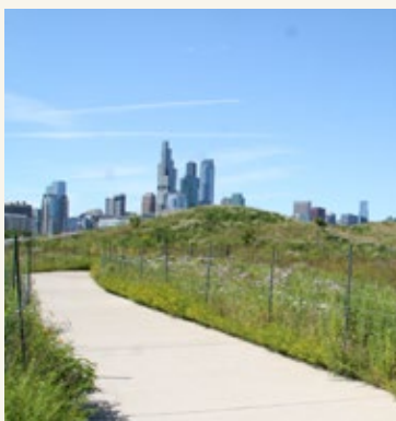
Northlery Praire Island