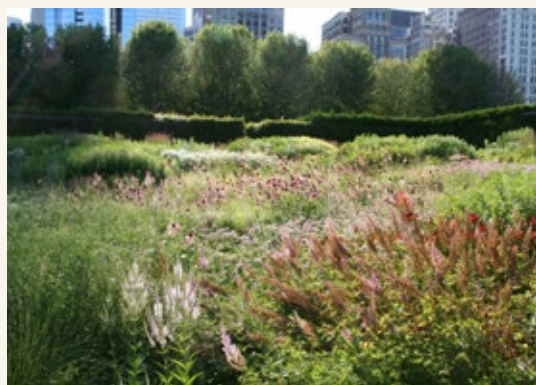
Lurie Garden, designed by Piet Oudolf