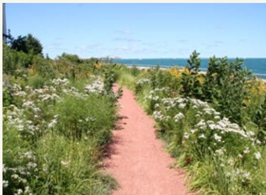
Oceanarium, designed by Roy Diblick